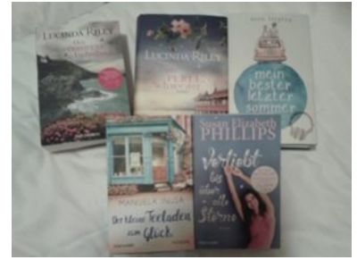
Meine gekauften und signierten Bücher

Ich möchte mich an dieser Stelle ganz herzlich bei den sehr netten Mitarbeitern von Randomhouse für die Organisation dieses Events bedanken. Sie haben es wirklich schön gemacht und es klappte alles wunderbar! Auch an die Autoren geht mein Dank, das sie sich Zeit für die Leser und Fans genommen haben. Ich fand den einen oder anderen etwas privateren Einblick sehr interessant und das machte sie eigentlich noch sympathischer!