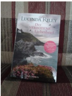
Lucinda Riley - Der verbotene Liebesbrief

Diese Buch-Einkäufe waren am Samstag fest eingeplant :-)