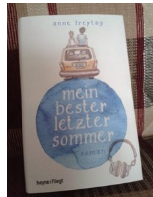
Anne Freytag - Mein bester letzter Sommer

Diese Bücher waren Spontankäufe, neugierig geworden durch die Veranstaltungen, die am Sonntag statt fanden. Aber auch diese sind signiert :-)