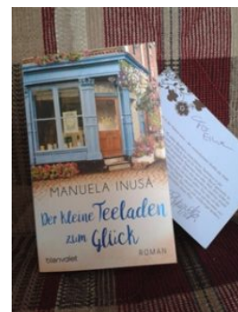
Manuela Inusa - Der kleine Teeladen zum Glück